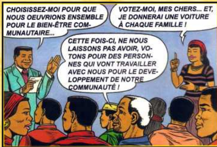
PROFIL DU CANDIDAT A ELIRE