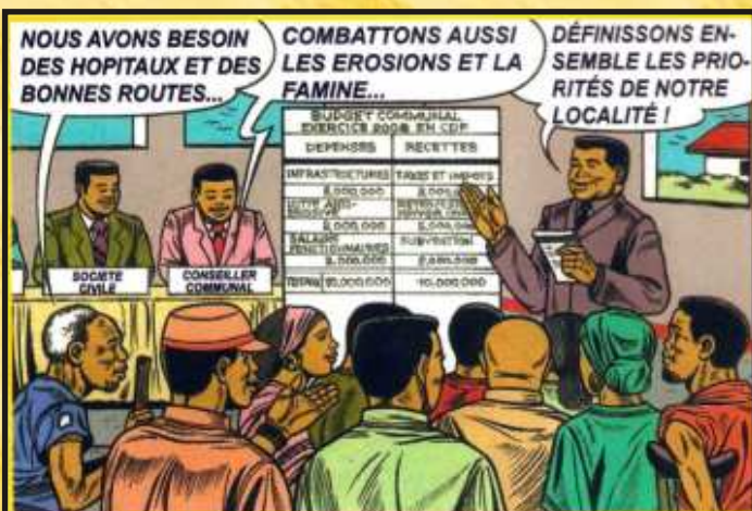
ELABORATION DU BUDGET PARTICIPATIF